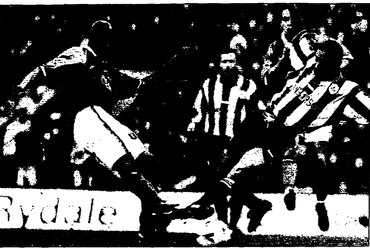
مهاجم فريق استون فيلا ميون ديوان (إلى اليمين) يحاول اقتحام الكرة من امام مدافع شيلدا وينزداي (يسار) ويوكر